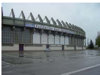
Estadio José Zorrilla.