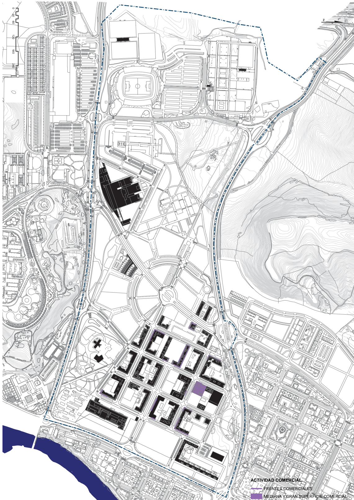
Plano de actividad comercial.