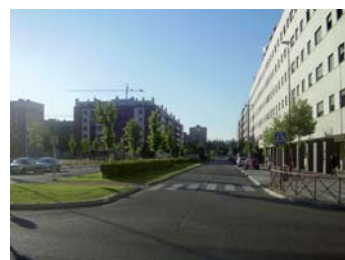
Calle Monasterio de Santo Domingo de Silos.