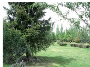
Parque lineal junto a la calle Padre José Acosta.