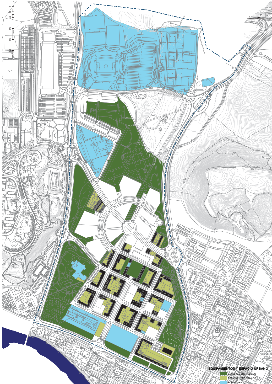
Plano de equipamientos y espacios libres.