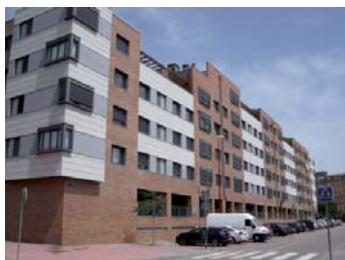
El bloque lineal de doble crujía formando diferentes agrupaciones es la tipología claramente dominante en Villa del Prado.