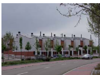
Agrupación de viviendas unifamiliares adosadas junto a la calle del Monasterio de San Lorenzo de El Escorial.

La retícula está aproximadamente apoyada en un viario generador que conecta el barrio de Huerta del Rey con el barrio de Parquesol.