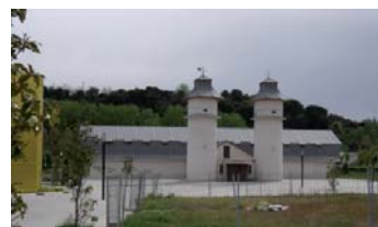
Granja Escuela José Antonio, recientemente restaurada.