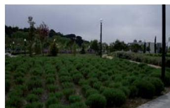
Parque junto a la sede de las Cortes y a la Granja Escuela José Antonio.