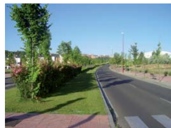
Calle Monasterio de San Lorenzo de El Escorial.