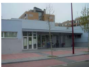
Escuela infantil Campanilla.

La sede de las Cortes de Castilla y León y la Delegación Regional de la Agencia Tributaria se incorporan al eje de actividad de la avenida de Salamanca, mientras que el Centro Cultural Miguel Delibes ayuda a consolidar la zona del Estadio José Zorrilla y el recinto ferial, donde se prevé la construcción de un gran espacio comercial y de servicios (Valladolid Arena).