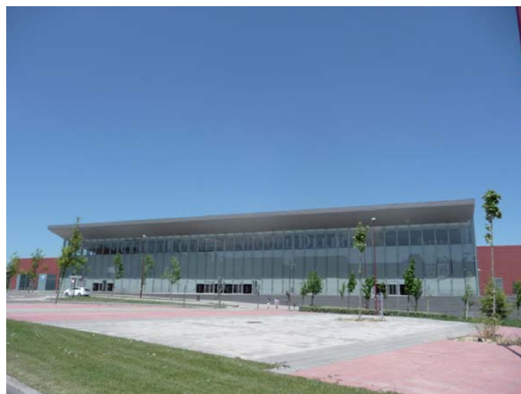
Centro Cultural Miguel Delibes.