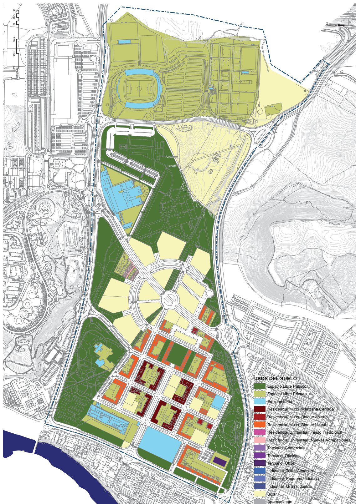
Plano de usos del suelo.