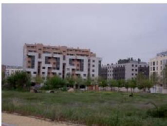
Dos de los solares sin ocupar que se encuentran dispersos por todo el barrio.