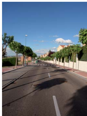
Calle de la Flauta Mágica.

No obstante, en unas zonas del barrio predomina la vivienda unifamiliar aislada y en otras la vivienda unifamiliar pareada o adosada.