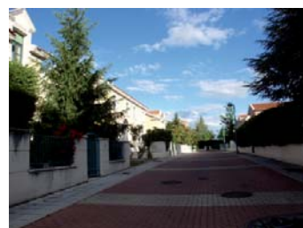
Calle de coexistencia.