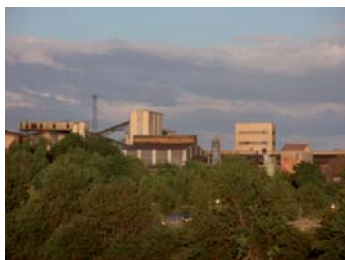
Factoría de Lingotes Especiales.