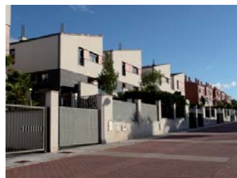
Viviendas unifamiliares adosadas.