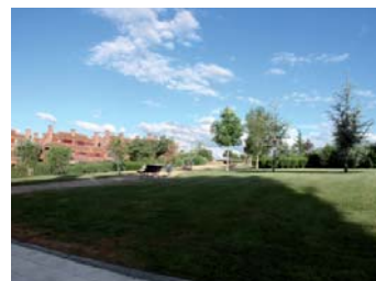
Parque en la zona noreste de Fuente Berrocal.