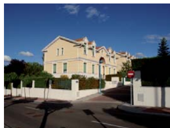
Vivienda unifamiliar aislada.