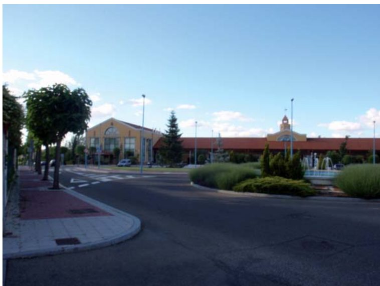
Restaurante junto a la plaza de la Ópera.