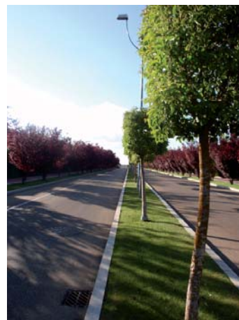
Calle del Barbero de Sevilla.

Por otro lado, en el Plan Parcial La Galera hay otro parque que hace de colchón entre el barrio y la carretera de Fuensaldaña.