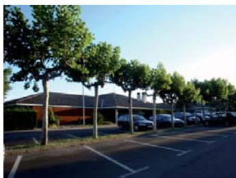
Club de campo La Galera.